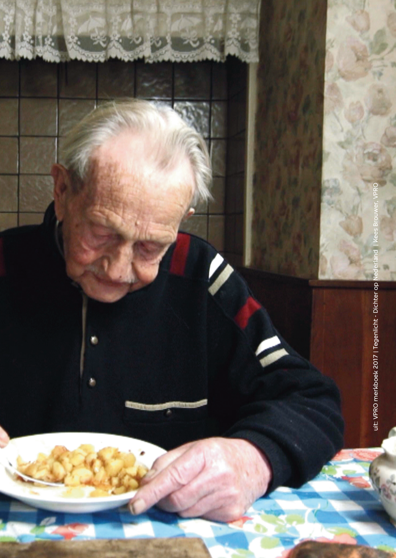
uit: VPRO merkboek 2017 | Tegenlicht - Dichter op Nederland | Kees Brouwer, VPRO