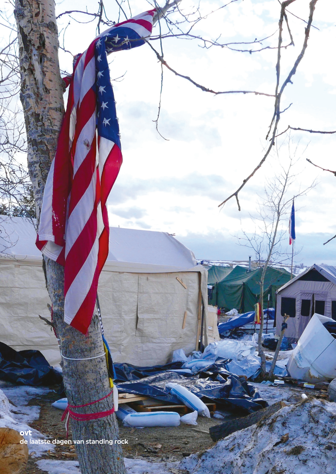
ovt de laatste dagen van standing rock